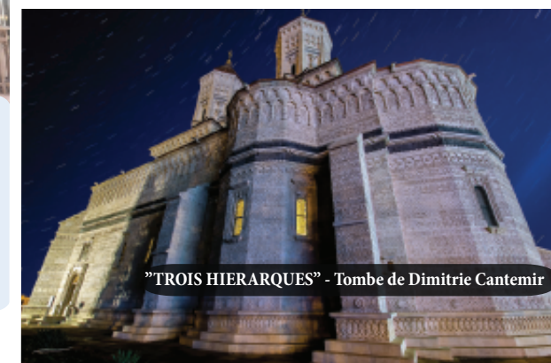
"TROIS HIERARQUES" - Tombe de Dimitrie Cantemir