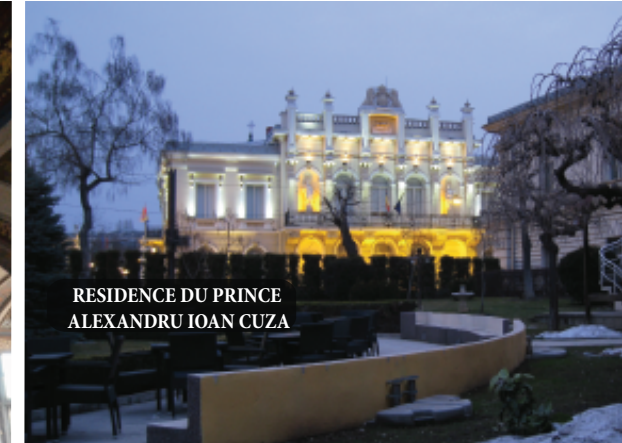
RESIDENCE DU PRINCE ALEXANDRU IOAN CUZA